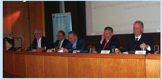
Συνέδριο για τα 60 χρόνια Ευρωπαϊκής ολοκλήρωσης που συνδιοργανώθηκε από το Τμήμα ΔΕΣ και τη Βουλή των Ελλήνων

Το κόστος του προγράμματος ανά εξάμηνο σπουδών ανέρχεται σε 2300 Ευρώ. Για το σύνολο του προγράμματος το κόστος είναι 6900 Ευρώ.