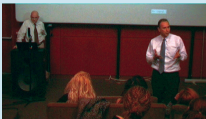
Αναλύοντας στρατηγικές χειρισμού κρίσεων σε κινηματογραφική ταινία που προβλήθηκε

Για τη βελτίωση της εκπαίδευσης χρησιμοποιούνται όλα τα σύγχρονα τεχνολογικά μέσα, συμπεριλαμβανομένης της προβολής κινηματογραφικών ταινιών που αναλύονται για το εκπαιδευτικό τους περιεχόμενο.