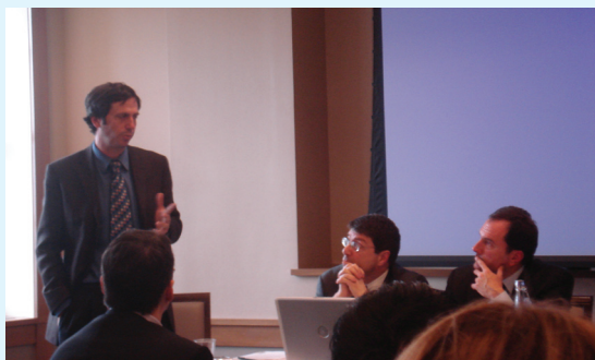
Συζήτηση για την παγκόσμια οικονομική κρίση σε κοινή ημερίδα του ΠΜΣ του Τμήματος ΔΕΣ με το Columbia University, στη Νέα Υόρκη

να προσφέρουμε τις απαραίτητες γνώσεις και ικανότητες καθώς και τις προϋποθέσεις επιτυχίας των αποφοίτων μας σε ότι εκείνοι επιλέξουν στη μετέπειτα σταδιοδρομία τους. Για το λόγο αυτό παροτρύνουμε τους φοιτητές και τις φοιτήτριές μας να βελτιώνουν τις επικοινωνιακές τους δυνατότητες τόσο στο γραπτό όσο και στον προφορικό λόγο. Επίσης ενθαρρύνουμε την παρουσίαση εργασιών σε όλα σχεδόν τα μαθήματα με τη χρήση σύγχρονων μέσων. Βοηθούμε τους φοιτητές μας να αναπτύξουν την ικανότητά τους στην οργάνωση ανεξάρτητης και δημιουργικής έρευνας. Τέλος, είμαστε πάντα πρόθυμοι να εξυπηρετούμε τους φοιτητές και τις φοιτήτριές μας ώστε να γίνεται η φοιτητική ζωή τους πιο γόνιμη και παραγωγική.