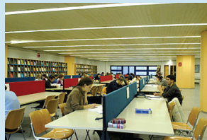
Το αναγνωστήριο της βιβλιοθήκης του ΠΑΠΕΙ

μάτων. Τα προπαρασκευαστικά μαθήματα έχουν διάρκεια 60 ωρών, γίνονται μέσα Σεπτεμβρίου, πριν από την έναρξη των μαθημάτων και αφορούν στα αντικείμενα Διεθνείς Σχέσεις, Διεθνής Πολιτική Οικονομία, Διεθνείς και Ευρωπαϊκοί Θεσμοί, Μεθοδολογία Έρευνας, Αγγλική και Γαλλική Ορολογία.