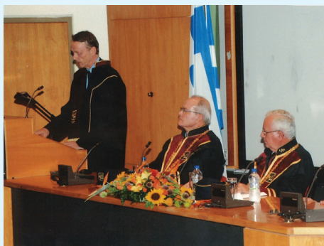
Ομιλία του Καθηγητή του Peter Katzenstein (Cornell University), Προέδρου της Αμερικανικής Εταιρείας Πολιτικής Επιστήμης, με θέμα τη σύγκρουση των πολιτισμών κατά την απονομή του τιμητικού διδακτορικού από το Τμήμα ΔΕΣ