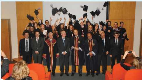
Αποφοίτηση μεταπτυχιακών φοιτητών στην Αίθουσα Τελετών του ΠΑΠΕΙ

Η αξιολόγηση των υποψηφιοτήτων γίνεται σε δύο στάδια. Στο πρώτο στάδιο αξιολογούνται τα τυπικά προσόντα των υποψηφίων. Στο δεύτερο στάδιο, όσοι υποψήφιοι προκριθούν καλούνται σε προσωπική συνέντευξη για την περαιτέρω αξιολόγησή τους.