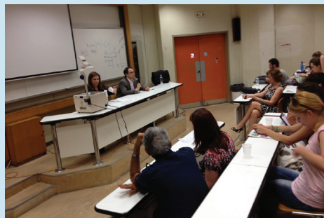
Η πρέσβης της Αυστραλίας κα Jenny Bloomfield αναλύει στους μεταπτυχιακούς φοιτητές τη στρατηγική των μεγάλων δυνάμεων στον Ειρηνικό

Το Τμήμα ΔΕΣ του ΠΑΠΕΙ έχει στελεχωθεί πλήρως και είναι ένα από τα μεγαλύτερα και ισχυρότερα Τμήματα στην Ελλάδα που προσφέρει ανώτατη εκπαίδευση στα πεδία της διεθνούς και ευρωπαϊκής πολιτικής. Στο πλαίσιο συνεργασίας μας με άλλα ελληνικά και ξένα ιδρύματα, το διδακτικό προσωπικό του Τμήματος συχνά εμπλουτίζεται από εξαιρετικού κύρους πανεπιστημιακούς επιστήμονες και ερευνητές από την Ελλάδα και το εξωτερικό, οι οποίοι (ή οι οποίες) συμμετέχουν στο πρόγραμμα μετά από πρόσκληση.