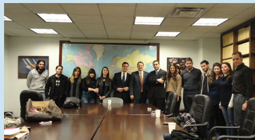
Ενημέρωση μεταπτυχιακών φοιτητών από τη μόνιμη Ελληνική αντιπροσωπεία στον Οργανισμό Ηνωμένων Εθνών (ΟΗΕ), Νέα Υόρκη

Κάθε έτος γίνονται επιδοτούμενες εκπαιδευτικές επισκέψεις στο εξωτερικό. Μέχρι τώρα έγιναν στις Βρυξέλλες, στις Ηνωμένες Πολιτείες και στην Κύπρο. Επίσης, προσκαλούνται ειδικοί για διαλέξεις και διοργανώνονται σεμινάρια και συνέδρια στο πλαίσιο των δραστηριοτήτων του ΠΜΣ και του Τμήματος.