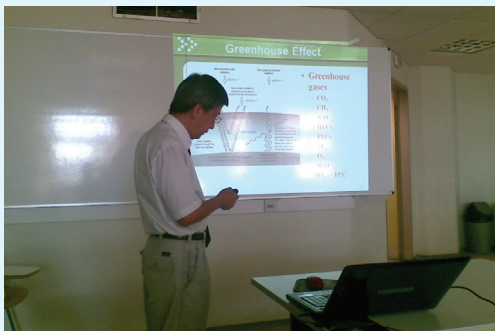
Ο Καθηγητής κος Albert Chu (National Cheng Kung University, Taiwan) αναλύει την περιβαλλοντική πολιτική και διπλωματία για το φαινόμενο του θερμοκηπίου και την παγκόσμια κλιματική αλλαγή

Το Πανεπιστήμιο βρίσκεται στις παρυφές του λόφου του Προφήτη Ηλία, δίπλα στο Πασαλιμάνι και στην Καστέλα, κοντά στο κέντρο του Πειραιά, σε ένα σύγχρονο κτίριο, ενώ λόγω της ταχύτατης ανάπτυξής του απλώνεται και σε γύρω κτίρια.