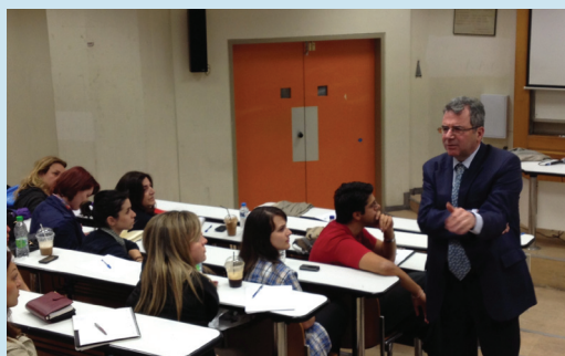
Ο πρέσβης της Ελλάδας στη Ρουμανία κος Γεώργιος Πουκαμισάς παρουσιάζει στους μεταπτυχιακούς φοιτητές την Ελληνική εξωτερική πολιτική στα Βαλκάνια

Τέλος, οι φοιτητές και οι φοιτήτριες μπορούν να κάνουν χρήση της βιβλιοθήκης του ΠΑΠΕΙ που αποτελεί μέλος του Δικτύου των Ελληνικών Ακαδημαϊκών Βιβλιοθηκών (HEAL Link). Η βιβλιοθήκη φιλοξενεί περί τις 50000 τόμους, εκατοντάδες ερευνητικά περιοδικά και πλήθος συνδρομών σε ηλεκτρονικές βάσεις δεδομένων. Οι μεταπτυχιακοί φοιτητές και φοιτήτριες μπορούν να έχουν και απομακρυσμένη πρόσβαση στις ηλεκτρονικές υπηρεσίες της βιβλιοθήκης (μέσω σύνδεσης VPN).