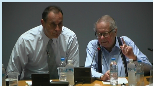
Ο διασημότερος εν ζωή θεωρητικός των Διεθνών Σχέσεων Καθηγητής κος Kenneth Waltz (University of California, Berkeley & Columbia University) σε ημερίδα του ΠΜΣ στο ΔΕΣ

Σημειώνεται ότι οι διεθνείς και οι ευρωπαϊκές σπουδές του Τμήματος ΔΕΣ και του μεταπτυχιακού του προγράμματος προσφέρουν μια εξαιρετική ευκαιρία για να κατανοήσουν οι φοιτητές και φοιτήτριές μας το πώς είναι δομημένος, πως λειτουργεί και πως εξελίσσεται ο σύγχρονος κόσμος στο κατώφλι του 21ου αιώνα.