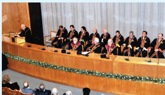
Ο πρόεδρος της δημοκρατίας κος Κάρολος Παπούλιας αναλύει ζητήματα εξωτερικής πολιτικής κατά την απονομή τιμητικού διδακτορικού από το Τμήμα ΔΕΣ

Το Πρόγραμμα Μεταπτυχιακών Σπουδών (ΠΜΣ) του Τμήματος Διεθνών και Ευρωπαϊκών Σπουδών (ΔΕΣ) του Πανεπιστημίου Πειραιώς (ΠΑΠΕΙ), απευθύνεται σε όλους όσους θέλουν να αποκτήσουν εξειδικευμένες γνώσεις στους τομείς των Διεθνών και των Ευρωπαϊκών Σπουδών και να σταδιοδρομήσουν στον επιχειρηματικό στίβο, σε κρατικούς και διεθνείς οργανισμούς, στα μέσα μαζικής επικοινωνίας, σε διεθνείς οικονομικές δραστηριότητες, στο χρηματοοικονομικό και τραπεζικό τομέα και ασφαλώς στα Ευρωπαϊκά όργανα και τους ευρωπαϊκούς θεσμούς.