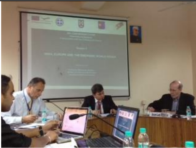
(Από το συνέδριο στο Jawaharlal Nehru University στην Ινδία)