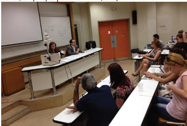
(Από την ομιλία της Jenny Bloomfield, της Πρέσβευς της Αυστραλίας)

- Daniel B. Smith, Πρέσβης των ΗΠΑ στην Ελλάδα, με θέμα "Transatlantic Relations and the current state of Greek-American Relations", στην Πρεσβεία των ΗΠΑ, στις 2 Μαΐου 2012.