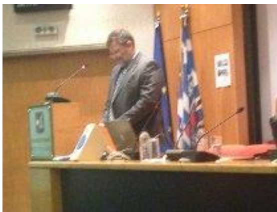
(Από τη συνάντηση και ομιλία με τον Πρέσβη της Γερμανίας Wolfgang Dold)

- Γεώργιος Πουκαμισάς, Πρέσβης της Ελλάδος στο Βουκουρέστι, με θέμα "Τα Βαλκάνια στο Σύστημα της Ελληνικής Εξωτερικής Πολιτικής. Δυνατότητες και προκλήσεις", στις 18 Μαΐου 2012.