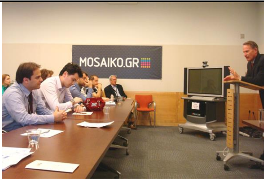
(Από την επίσκεψη στην Πρεσβεία των ΗΠΑ και την συνάντηση και συζήτηση με τον Πρέσβη)

- Daniel B. Smith, Πρέσβης των ΗΠΑ στην Ελλάδα, με θέμα "Transatlantic Relations and the current state of Greek-American Relations", στην Πρεσβεία των ΗΠΑ, στις 2 Μαΐου 2012.