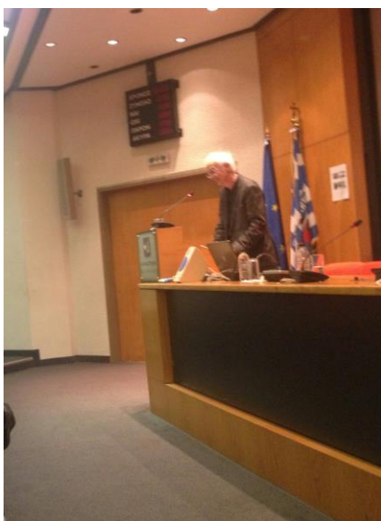
(Από τη διάλεξη του Helmut Schwarz, Καθηγητή και Προέδρου του Ιδρύματος Alexander von Humboldt)