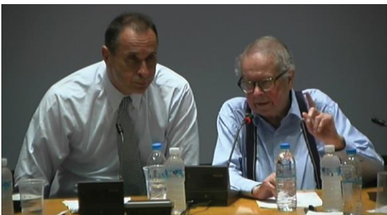
(Από την ομιλία του Kenneth Waltz στο πάνελ στρογγυλής τραπέζης)