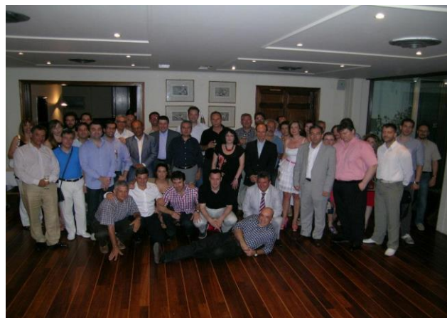
(Από τον εορτασμό της λήξης της ακαδημαϊκής χρονιάς 2011-12 στο φιλόξενο Ναυτικό Όμιλο Ελλάδος στον Πειραιά)

Η λήξη της ακαδημαϊκής χρονιάς 2011-12 εορτάστηκε με δείπνο στο εστιατόριο του Ναυτικού Ομίλου Ελλάδος στον Πειραιά, από όπου και η φωτογραφία που ακολουθεί.