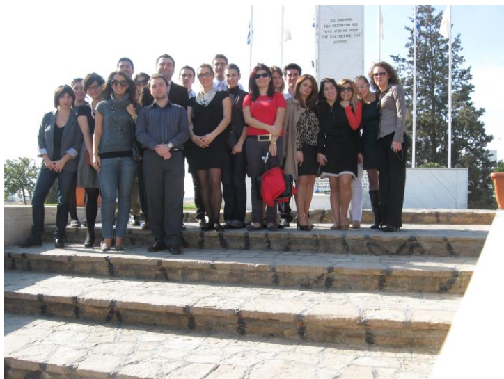
(Από την επίσκεψη των φοιτητών στην Κύπρο)