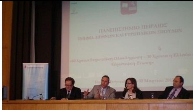
(Από την έναρξη του συνεδρίου για τα 30χρονα στην ΕΕ με την παρουσία των Βουλευτών)

➤ Συνέδριο οργανώθηκε από το Τμήμα Διεθνών & Ευρωπαϊκών Σπουδών, που τέθηκε υπό την αιγίδα της Βουλής των Ελλήνων, με θέμα "60 Χρόνια Ευρωπαϊκή Ολοκλήρωση-30 Χρόνια η Ελλάδα στην Ευρωπαϊκή Ένωση", στις 23-30 Μαρτίου 2012 στο Ευγενίδειο Ίδρυμα ( http://euractiv.gr/panepistimio-peiraia-60-xronia-eyropaiki-oloklirosi-30-xronia-i-ellada-stin-eyropaiki-enosi ), με τη συμμετοχή στα πάνελ ακαδημαϊκών από τα άλλα ΑΕΙ, βουλευτών και ειδικών.