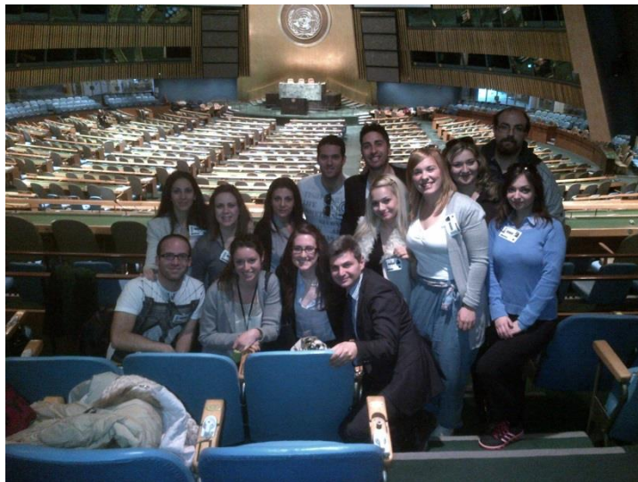
(Από την επίσκεψη των μεταπτυχιακών φοιτητών στην έδρα των Ηνωμένων Εθνών στην Νέα Υόρκη)