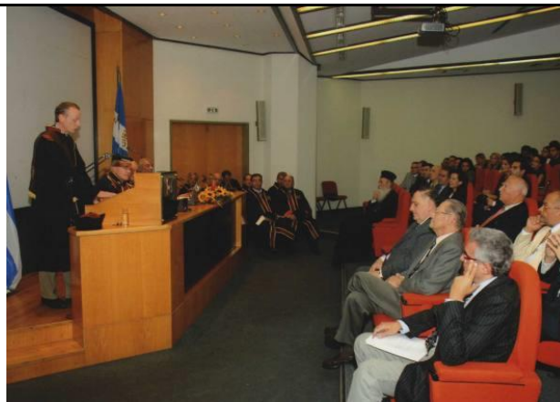
(Απονομή Τιμητικού Διδακτορικού στον Καθηγητή του Πανεπιστημίου Cornell κ. Peter Katzenstein)

- Στον Καθηγητή του πανεπιστημίου Cornell Peter Katzenstein απονεμήθηκε ο τίτλος του Επίτιμου Διδάκτορα σε ειδική τελετή στο Πανεπιστήμιο Πειραιώς στις 11 Οκτωβρίου 2010. Η laudatio εκφωνήθηκε από τον Καθηγητή Αθανάσιο Πλατιά .