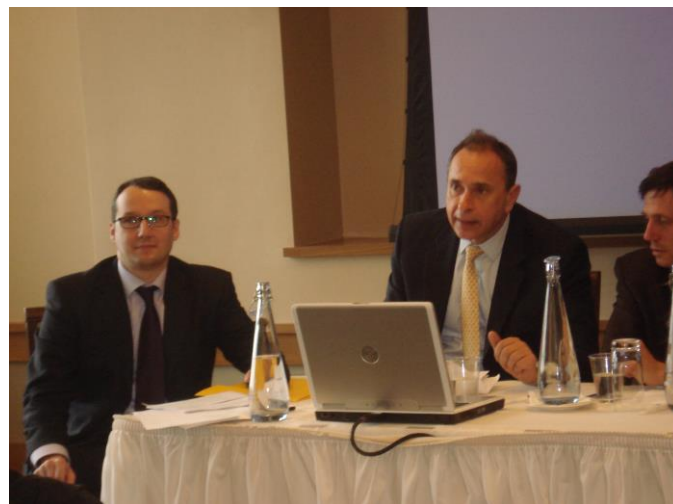
(Συνέδριο του Τμήματος με το Πανεπιστήμιο Columbia στη Νέα Υόρκη στις 14/11/11)

Στο διαρρεύσαν διάστημα τριετίας το Τμήμα μας οργάνωσε και υλοποίησε διεθνή συνέδρια στην αλλοδαπή.