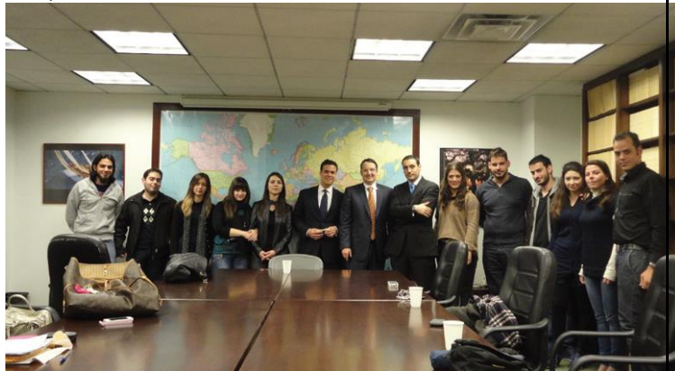
(Από την επίσκεψη των φοιτητών στη Νέα Υόρκη το 2012)

από τον Αναπληρωτή Καθηγητή Νικόλαο Φαραντούρη (Μάιος 2013).