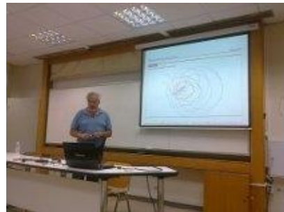
(Από τη Διάλεξη του Καθηγητή του Michigan University κ. Γεώργιου Τσεμπελή)