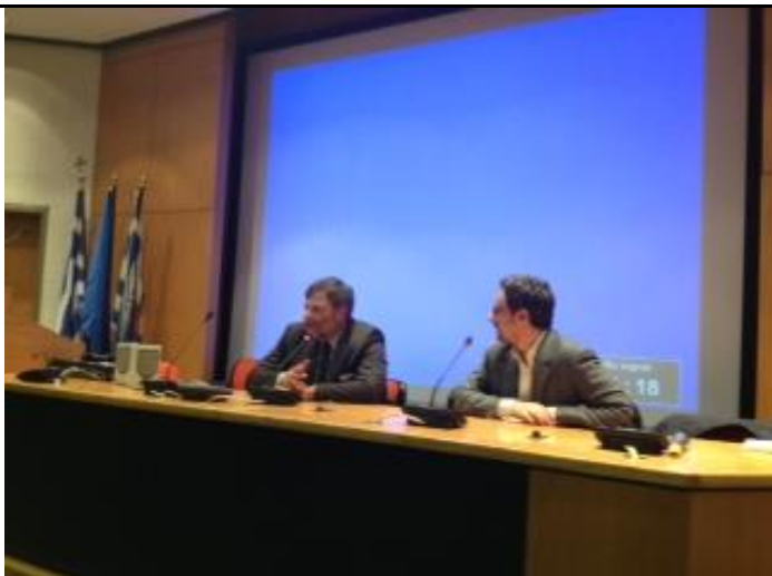
(Στιγμιότυπο από τον σχολιασμό του Wolfgang Dold, του πρέσβη της Γερμανίας επί της ταινίας)

- Σε μια από τη σειρά προβολής ταινιών κλήθηκε και συμμετείχε ο Wolfgang Dold, πρέσβης της Γερμανίας, για σχολιασμό και ανάλυση της γερμανικής ταινίας "Goodbye Lenin" στο πλαίσιο του μαθήματος "Διεθνείς Σχέσεις και Κινηματογράφος", στις 20 Μαρτίου 2013.