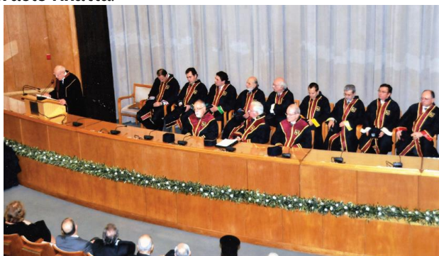
(Από την τελετή αναγόρευσης του Προέδρου της Δημοκρατίας)

- Στον Εξοχότατο Πρόεδρο της Δημοκρατίας κκ. Κάρολο Παπούλια απονεμήθηκε ο τίτλος του Επίτιμου Διδάκτορα σε ειδική πανηγυρική τελετή που οργανώθηκε στο Ευγενίδιο Ίδρυμα στις 10 Μαρτίου 2011. Η laudatio εκφωνήθηκε από τον Καθηγητή Αθανάσιο Πλατιά .