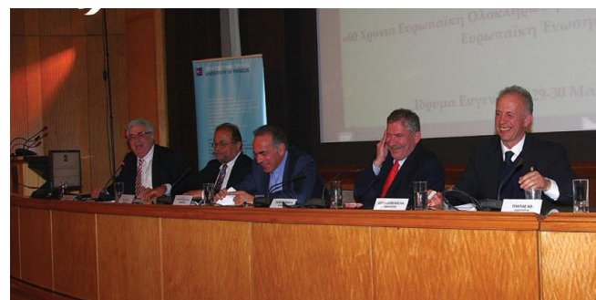
(Από το πάνελ για τις διεθνείς σχέσεις από τη διημερίδα για τα 30χρονα στην ΕΕ στο Ευγενίδειο)

➤ Συνδιοργανωτής στο Economist Debate που πραγματοποιήθηκε στις 20 Ιουνίου 2013 με θέμα «Θα έπρεπε η Ελλάδα να προχωρήσει σε μονομερή οριοθέτηση ΑΟΖ;», με εισηγητές τους Καθηγητές Χρήστο Ροζάκη και Θεόδωρο Καρυώτη και σχολιαστές τον Καθηγητή Ιωάννη Μάζη και τον Αναπληρωτή Καθηγητή Πέτρο Λιάκουρα.