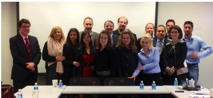
(Αναμνηστική φωτογραφία με τους μεταπτυχιακούς φοιτητές από το συνέδριο της 29 ης Απριλίου 2013 στο New York University)

- Οργάνωσε σε συνεργασία με το Πανεπιστήμιο Jawaharlal Nehru και διεξήγε διεθνές συνέδριο στο Νέο Δελχί της Ινδίας, με θέμα India, Europe and the Emerging World Order στις 28 Φεβρουαρίου 2013, με τη συμμετοχή με εισηγήσεις τους του Καθηγητή Αθανάσιου Πλατιά και του Αναπληρωτή Καθηγητή Νικολάου Φαραντούρη .